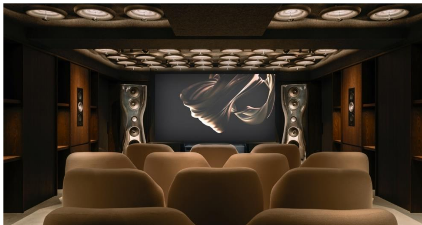
全球旗艦店倫敦 KEF Music Gallery