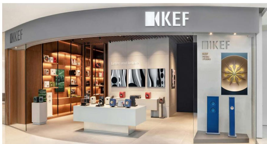
KEF Music Studio 成都體驗店

除了在香港開設 KEF Music Gallery，KEF 積極拓展全球業務。去年，東京 KEF Music Gallery 開業；今年，成都 KEF Music Studio 及全球旗艦店倫敦 KEF Music Gallery 相繼開幕，而北京 KEF Music Gallery 也將於下月試業，進一步擴大 KEF 在策略市場的影響力，並加強這些關鍵區域的市場營銷和銷售發展。